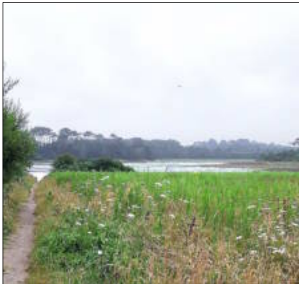
La rivière de Pont-l'Abbé, sous ses aspects parfois idylliques, cache de nombreux pièges, notamment des vasières et des zones de fort courant.

La partie de pêche a tourné au drame, ce week-end, pour deux amis, sur la rivière de Pont-l'Abbé.