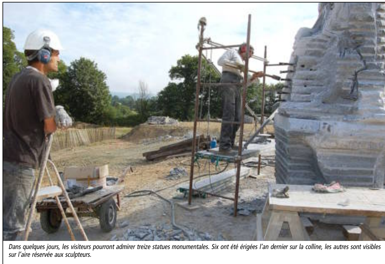
Dans quelques jours, les visiteurs pourront admirer treize statues monumentales. Six ont été érigées l'an dernier sur la colline, les autres sont visibles sur l'aire réservée aux sculpteurs.

La Vallée des Saints, à Carnoët (22), peut enfin être ouverte au public. La sous-préfecture de Guingamp estime que le site présente toutes les garanties en matière de sécurité.