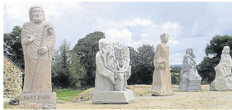
En attendant d'être installées dans la vallée, les nouvelles statues sont visibles sur le chantier.

Pour l'arrivée de ses nouvelles statues, l'association de la Vallée des Saints veut marquer l'événement.