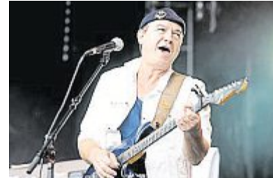
Soldat Louis se produira sur la scène de la Fête du Blé samedi soir à Pleudihen-sur-Rance.

« Very intime poteaux » est sorti l'an dernier. Vous travaillez aujourd'hui à un prochain disque ?