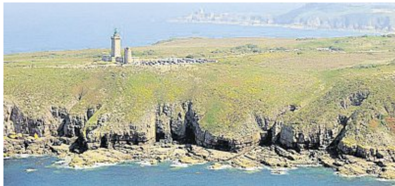
Le cap Fréhel et son phare, un site naturel de 400 ha.